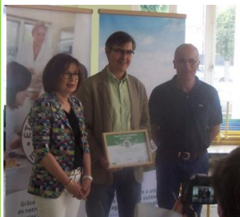
Mme la Conseillère Régionale, M le Maire, M le Président d'Arbio Aquitaine

La Commune de Paillet a eu l'honneur de recevoir le label « Territoire Bio Engagé » pour sa restauration scolaire, couronnant ainsi les efforts de la municipalité et des personnels de cantine depuis 2009 en faveur d'une alimentation plus saine et écologique à destination des élèves de l'école. Actuellement, 28% de l'alimentation de la cantine est d'origine biologique, et nous travaillons de plus en plus avec des producteurs locaux, certains livrant l'AMAP de l'Artolie tous les jeudi soir au foyer rural.