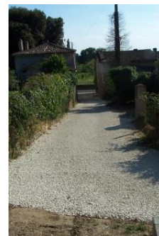
Chemin de Brisson