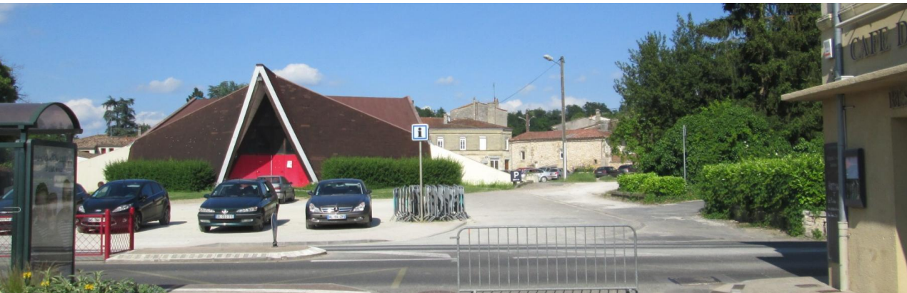
Le foyer rural aujourd'hui