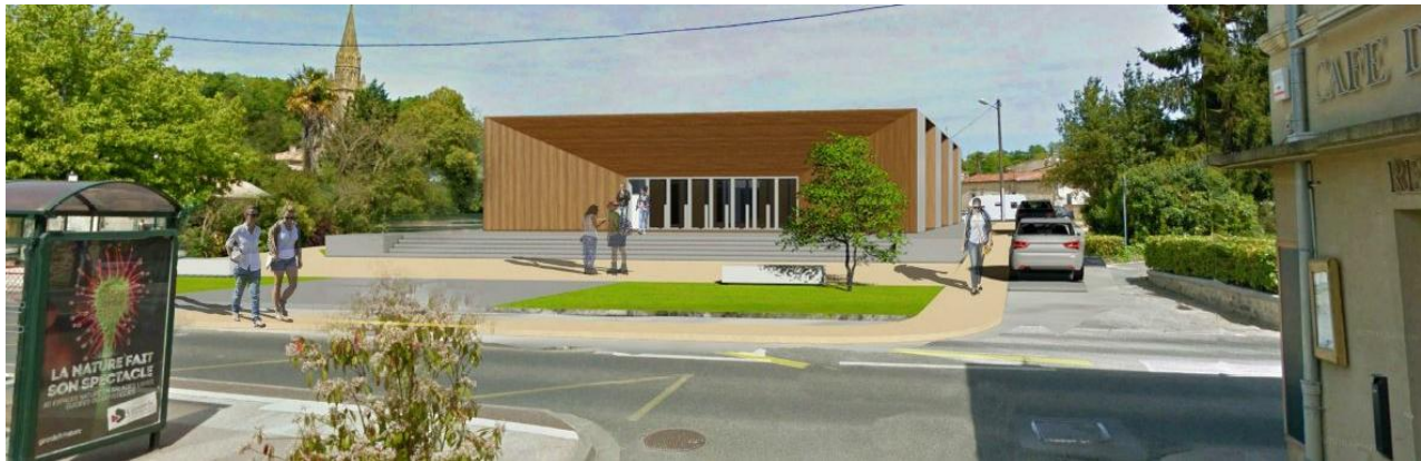
La salle polyvalente demain