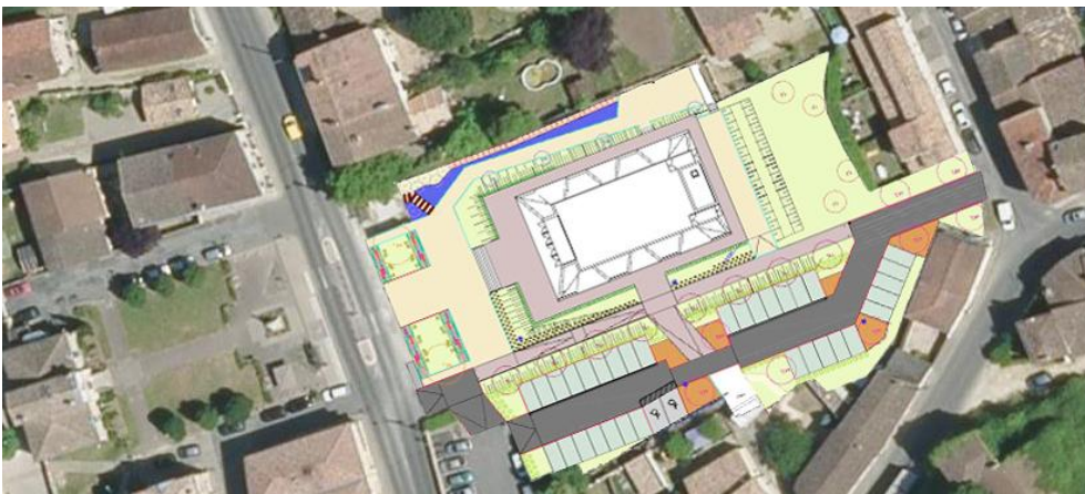
Vue aérienne à la fin des travaux